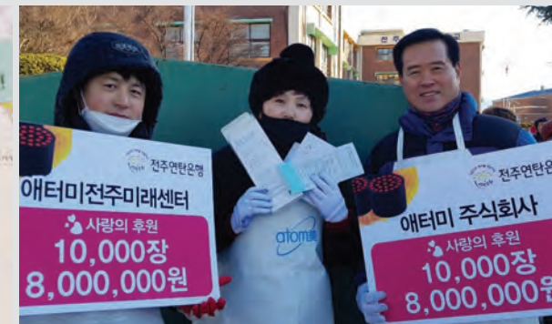
2015년부터 시작해 4년째 계속되는 애터미 연탄봉사활동