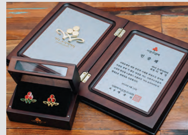
이해정 크라운 마스터의 아너소사이어티 회원 인증패