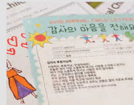
김미숙 스타마스터가 후원 아동들에게 받은 편지

“내가 쓰는 만원과 어려운 이웃들이 쓰는 만원은 그 가치와 효용이 다르다고 생각해요. 나에겐 커피값 2-3잔 일지 모르는 이 돈이 지구 어딘가의 누구에게 한달치 식량이 될 수도 있어요. 많은 사람들이 이 점을 알게 됐으면 좋겠습니다. 나눔이라는 것, 기부라는 것은 전혀 어려운 게 아닙니다.”